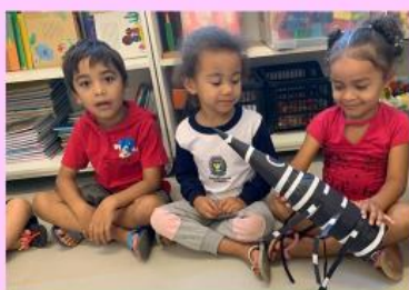
COMBATE A DENGUE

No primeiro trimestre, trabalhamos o acolhimento das crianças e de suas famílias de forma muito carinhosa e singular. Exploramos temas como identidade, o eu e o outro, as diferenças físicas, o antirracismo, a diversidade cultural e o respeito por todos.